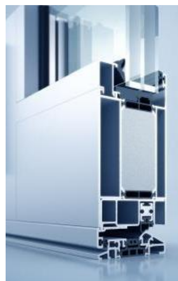
foto varianty s izolační vložkou